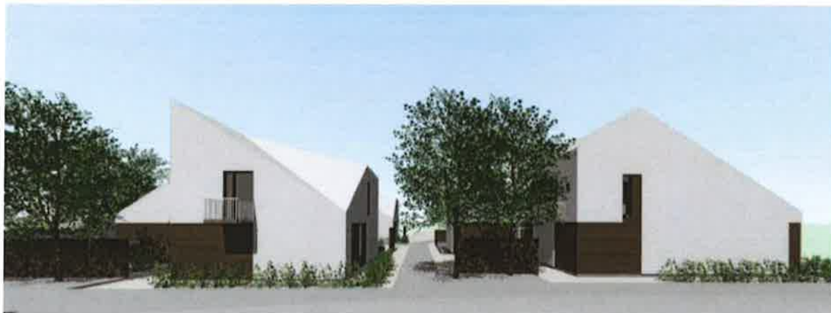
Mynd úr kynningarefni: Teiknaðar eru svalir á hús nr. 4 sem snúa beint að garði og svefnherbergjum íbúa á Hrauntungu 18.